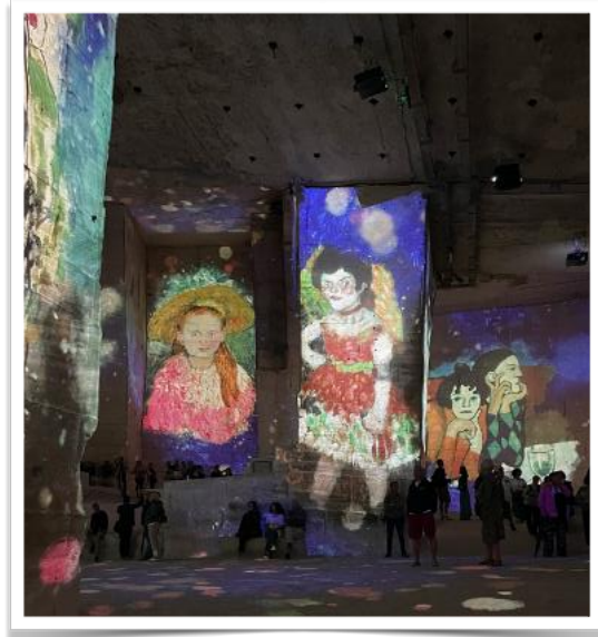
Lichtshow im Steinbruch

Im Anschluss besuchten die Teilnehmer die Carrières des Lumières. In diesen monumentalen, ehemaligen Kalksteinbrüchen werden im Rahmen einer multimedialen Show Kunstwerke großflächig an die bis zu 14 Meter hohen Felswände projiziert.