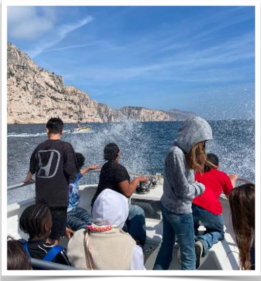
Wellengang in den Calanques

Auf dem Rückweg wurde die Gruppe zudem Zeuge einer Bergungsaktion, als ein Mann aus dem Wasser gerettet wurde. Um 17:20 Uhr kehrten die Reisenden zur Schule zurück und verbrachten den Abend in ihren Gastfamilien.