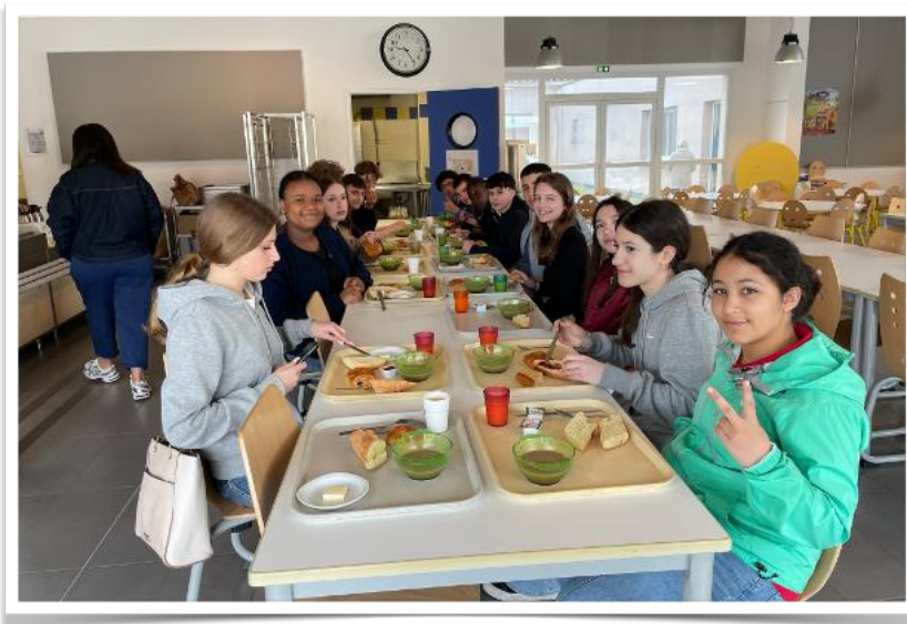
Frühstück in der Schulkantine